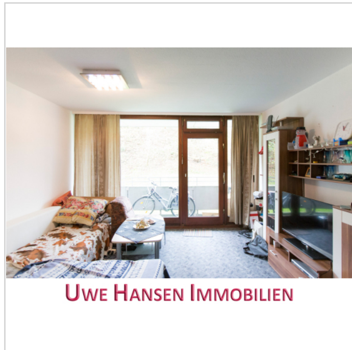
Das helle Wohnzimmer

Vermietbare Fläche: 31,66 m 2 Kaufpreis: 31.660,00 EUR x-fache Miete: 13,00